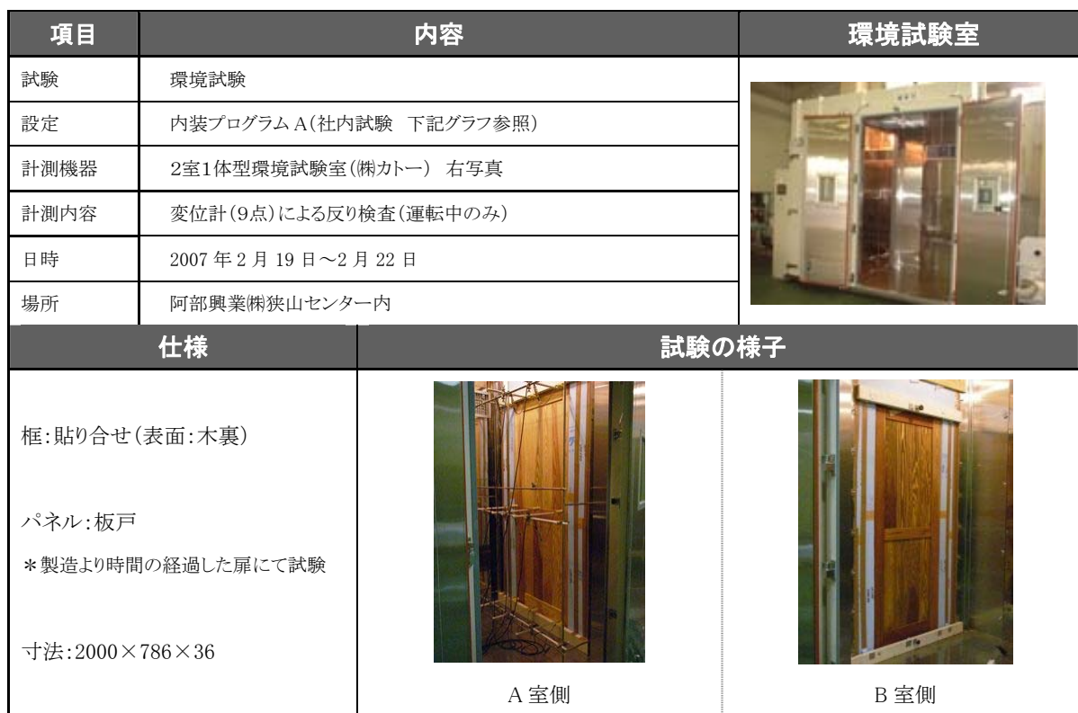
070219 杉無垢扉② パネル: 板戸 枠: 貼り合せ (木裏)

実際の室内よりも厳しい環境を人工的に再現し、材料や構造の科学的検証を進めています。