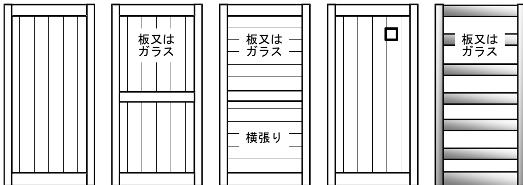
ED-1 24,500円 ED-2 26,000円 ED-3 28,000円 ED-4 27,500円 ED-5 31,500円